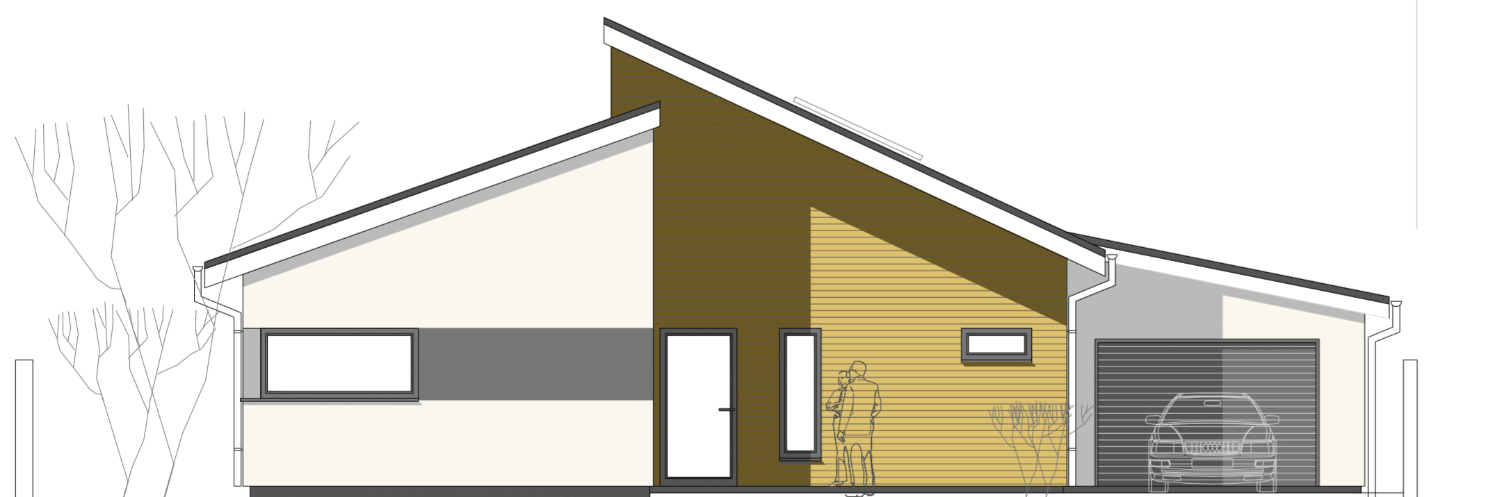
POHĽAD ČELNÝ M 1:75